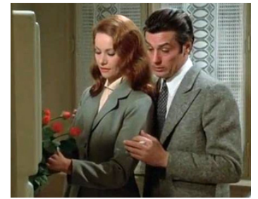
1975 FLIC STORY de Jacques Deray avec Alain Delon