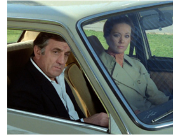
1977 UN PAPIILLON SUR L'ÉPAULE de Jacques Deray avec Lino Ventura