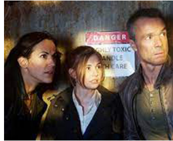
1977 LE MYSTÈRE DU TRIANGLE DES BERMUDES de René Cardona Jr avec Gretha, Carlos East