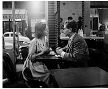
1960 LES MOUTONS DE PANURGE de Jean Girault avec Darry Cowl