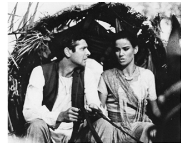
1963 KALI YUG, DÉESSE DE LA VENGEANCE (Kali Yug) de Mario Camerini avec Paul Guers