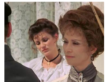
1986 LES EXPLOITS D'UN JEUNE DON JUAN (L'iniziazione) de Gianfranco Mingozzi