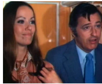
1974 L'INTRÉPIDE de Jean Girault avec Louis Velle