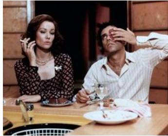
1977 LES BONSHOMMES (Pane, burro e marmellata) de Giorgio Capitani avec Enrico Monsano