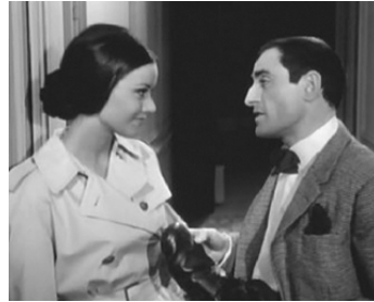
1964 YOYO de Pierre Étaix avec Pierre Étaix