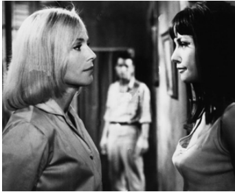
1964 UN CERTAIN DÉSIR (Die Lady) d'Hans Albin avec Ingrid Thulin, Paul Hubschmid