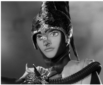
1959 LE TESTAMENT D'ORPHÉE de Jean Cocteau