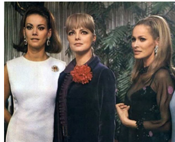
1967 PAS FOLLES LES MIGNONNES (Le dolci signore) de L. Zampa avec V. Lisi, U. Andress