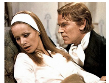
1969 COME TI CHIAMI, AMORE MIO ? de et avec Umberto Silva