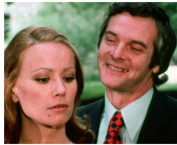
1974 LES OISEAUX DE MEIJU JINGU d'André Michel avec Paul Guers