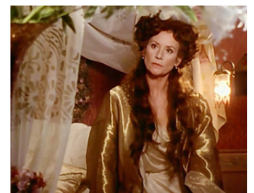
1997 LE ROUGE ET LE NOIR de Jean-Daniel Verhaeghe