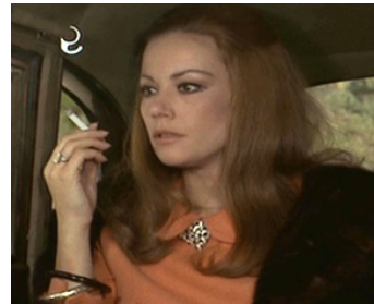
1967 FLAMMES SUR L'ADRIATIQUE d'Alexandre Astruc et Stjepan Cikes