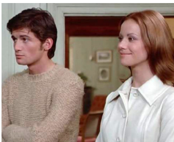
1970 UN PEU DE SOLEIL DANS L'EAU FROIDE de Jacques Deray avec Marc Porel