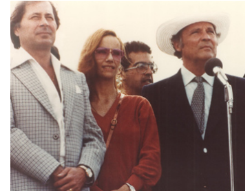
1979 FANTASTICA de Gilles Carle avec John Vernon