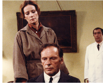
1983 CREDO de Jacques Deray avec Jean-Louis Trintignant