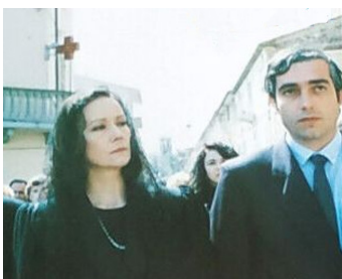
1988 LA FEMME DE MES AMOURS (Il frullo del passero) de Gianfranco Mingozzi avec C. Rosini