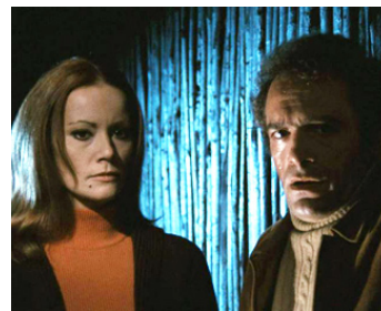
1971 LA BAIE SANGLANTE (Reazione a catena) de Mario Bava avec Luigi Pistilli