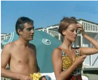
1967 JEUX D'ADULTES (Il padre di famiglia) de Nanni Loy avec Nino Manfredi