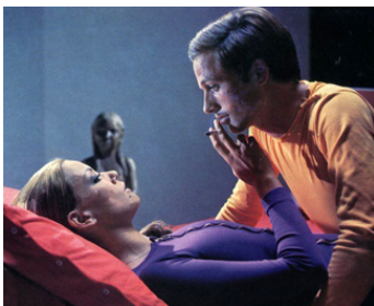
1968 ESCALATION (L'integrato sessuale) de Roberto Faenza avec Lino Capolicchio