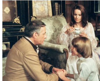
1979 L'ASSOCIÉ de René Gainville avec Michel Serrault