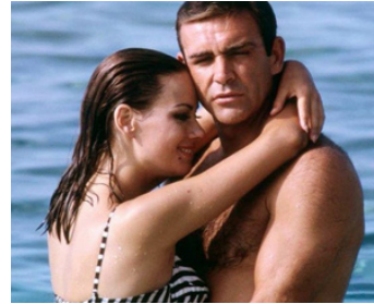
1965 OPÉRATION TONNERRE (Thunderball) de Terence Young avec Sean Connery