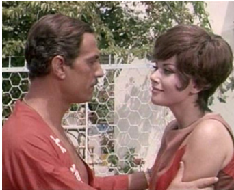
1966 OPÉRATION SAN GENNARO (Operazione San Gennaro) de Dino Risi avec Nino Manfredi