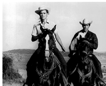
1968 LE BÂTARD (I Bastardi) de Duccio Tessari avec Giuliano Gemma