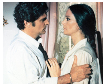
1984 LE REPENTI (Il Pentito) de Pasquale Squitieri avec Tony Musante