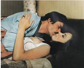
1978 VOYAGE AVEC ANITA (Viaggio con Anita) de Mario Monicelli avec Giancarlo Giannini