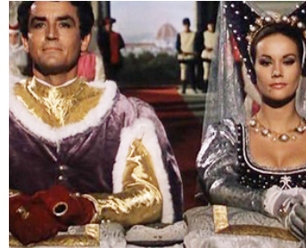
1966 BELFAGOR LE MAGNIFIQUE (L'arcidiavolo) d'Ettore Scola avec Vittorio Gassman