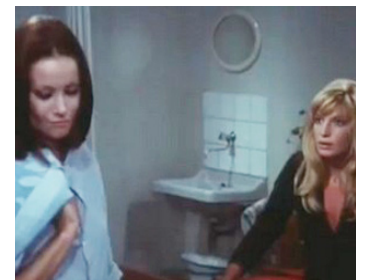
1972 LES ORDRES SONT LES ORDRES (Gli ordini sono ordini) de F. Giraldi avec M. Vitti