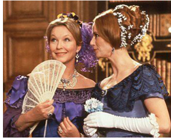
1982 LES SECRETS DE LA PRINCESSE DE CADIGNAN de Jacques Deray avec M. Vlady