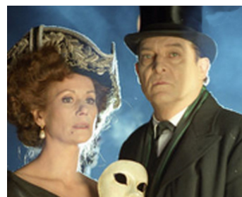
1994 LES MÉMOIRES DE SHERLOCK HOLMES de Peter Hammond avec Jeremy Brett